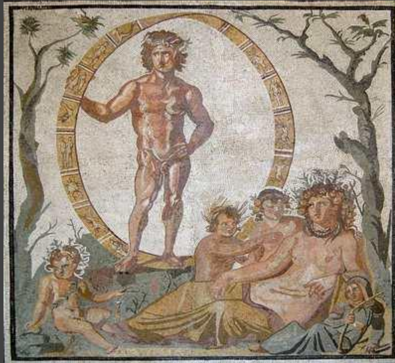
Gaia, mosaïque romaine d'une villa de Sentinum, III ème s. avant J.C.