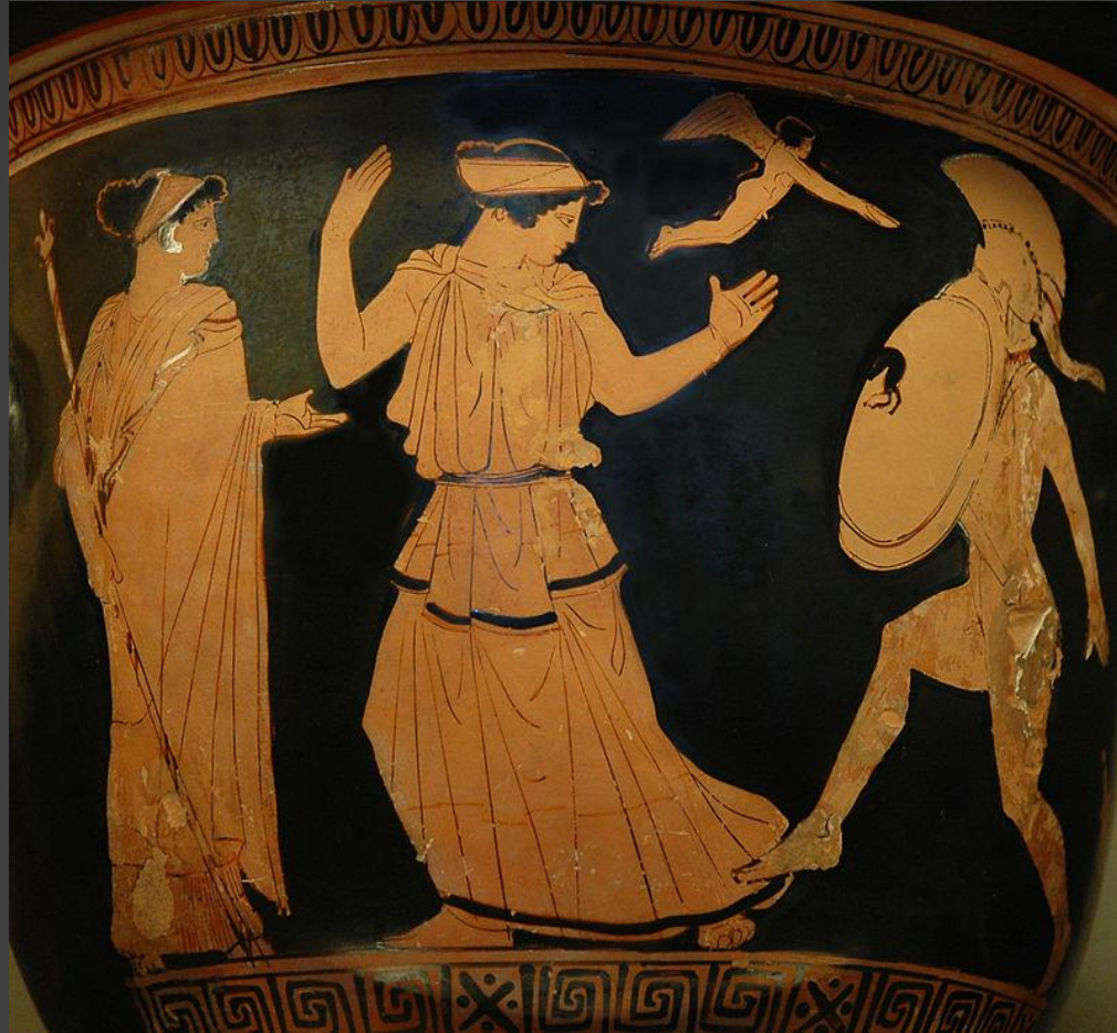
Ménélas retrouvant Hélène, cratère attique, Vème s. avant J.C., musée du Louvre